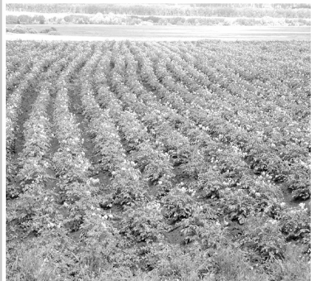
Материалы подготовил Николай КАРСУНЦЕВ

– Стараемся подходить к выращиванию картофеля с учётом многолетнего опыта возделывания этой культуры передовыми хозяйствами и новых технологий. Используем хорошо зарекомендовавшие себя семена картофеля, таких сортов, как «жуковский», «скарлетт», «янка» и другие. Одинаковую площадь с посеянной – 45 гектаров – вновь занимают пары, на которых земля своевременно обрабатывается от сорняков, полноценно отдыхает. Пока состояние посевов не вызывает тревоги, будем надеяться на хороший урожай. В ближайших планах – замена части технического парка фермерского хозяйства.